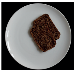
1-2 siivua ruisleipää (30 g)