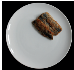
60 g silakkapihvejä

Osteoporoosia sairastavalle suositellaan 1 000-1 500 mg kalsiumia päivittäin.