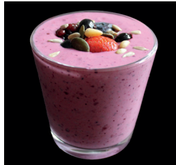
2 dl jogurttia