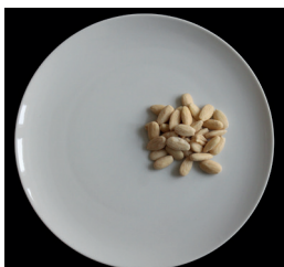
½ dl manteleita (35 g)

YHDESSÄ ANNOKSESSA on n. 100 mg kalsiumia