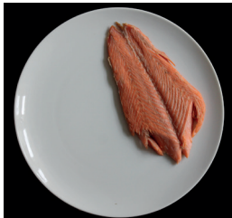
100 g kirjolohda