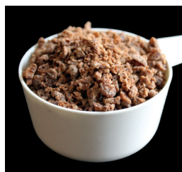
20 g soijarouhetta