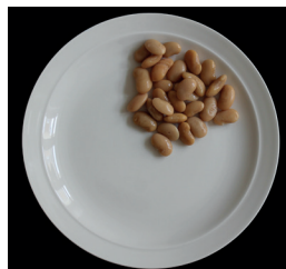
60 g keitettyjä valkoisia papuja