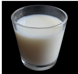
1,7 dl kalsiumilla täydennettyä kaurajuomaa