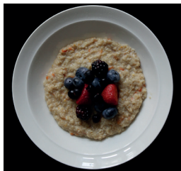
150 g maitopohjaista täysjyväpuuroa