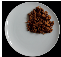
70 g nyhtökauraa