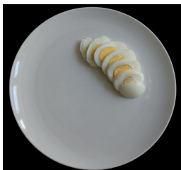
1 kananmuna (50 g)