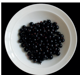
1,5 dl mustaherukoita (140 g)

YHDESSÄ ANNOKSESSA on n. 50 mg kalsiumia