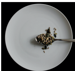
n. 1 rkl pähkinöitä ja siemeniä