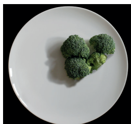
150 g parsakaalia