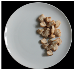
80 g broilersuikaleita