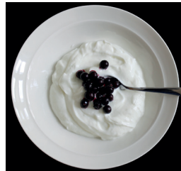
2 dl maitorahkaa

Esimerkit aikuisten proteiinin saanti- suosituksesta (0,83 g/paino- kilo/vrk)