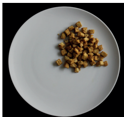
60 g tofua