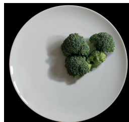
150 g parsakaalia