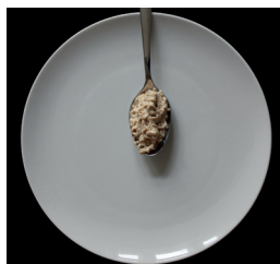
1 rkl tahinia