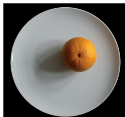
1 appelsiini (185 g kuorittuna)

YHDESSÄ ANNOKSESSA on n. 50 mg kalsiumia