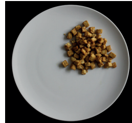
60 g tofua